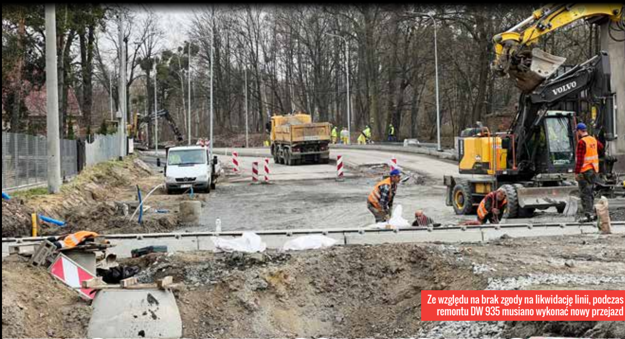
Ze względu na brak zgody na likwidację linii, podczas remontu DW 935 musiano wykonać nowy przejazd