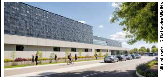
Wizualizacja UG Pietrowice Wielkie