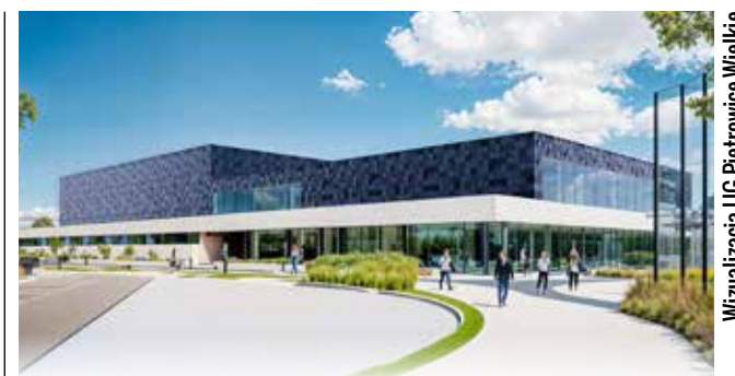
Wizualizacja UG Pietrowice Wielkie

lat pozbawienia wolności. Równocześnie toczą się wobec niej inne postępowania, a sprawa