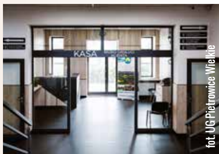
UJ Pietrowice Wielkie

Modernizacja urzędu to jednak dopiero pierwszy etap zmian - w planach jest odnowienie pozostałych kondygnacji oraz dalszy rozwój usług cyfrowych. Nowoczesna serwe-