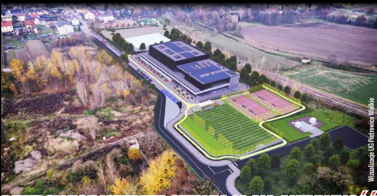
Wizualizacje UG Pietrowice Wielkie

Racibórz » Gmina Pietrowice Wielkie przygotowuje się do budowy nowoczesnego centrum sportowego. Inwestycja, której koszt szacuje się na około 40 mln zł brutto, ma powstać przy ul. Fabrycznej na terenie dawnego zakładu Polmos. Gmina złożyła już wniosek o unijne dofinansowanie w wysokości 60 procent. Nowy obiekt ma nie tylko podnieść jakość życia mieszkańców, ale także stać się impulsem do rozwoju sportu w regionie.