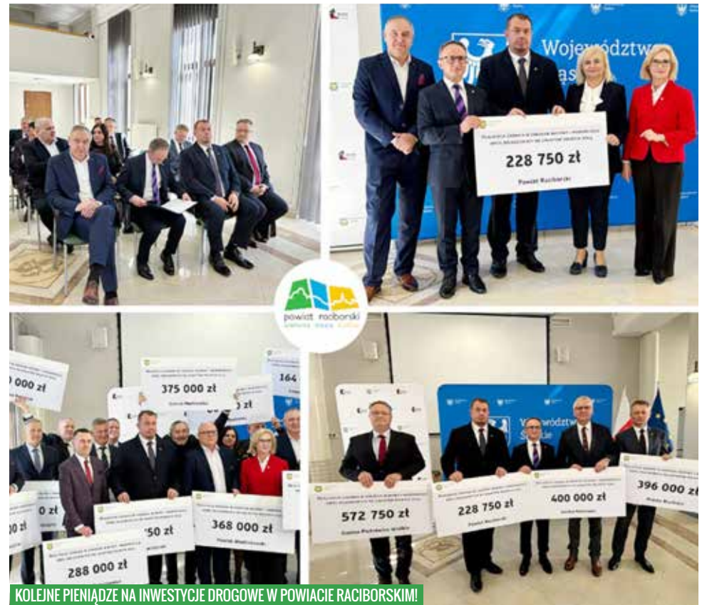
KOLEJNE PIENIĄDZE NA INWESTYCJE DROGOWE W POWIACIE RACIBORSKIM!