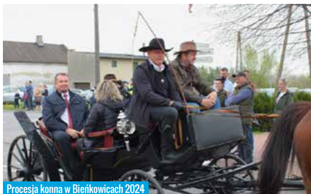
Procesja konna w Bieńkowicach 2024