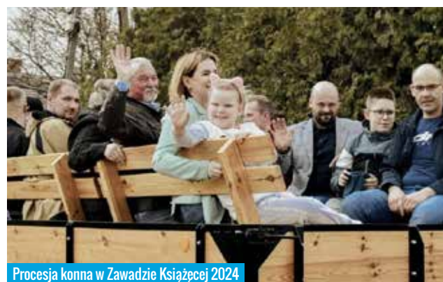
Procesja konna w Zawadzkie Książęcej 2024