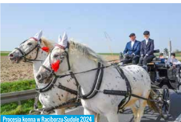
Procesja konna w Racibórz-Sudole 2024