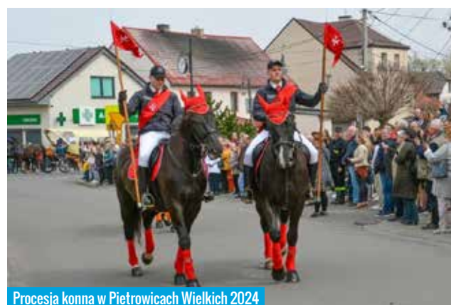
Procesja konna w Pietrowicach Wielkich 2024