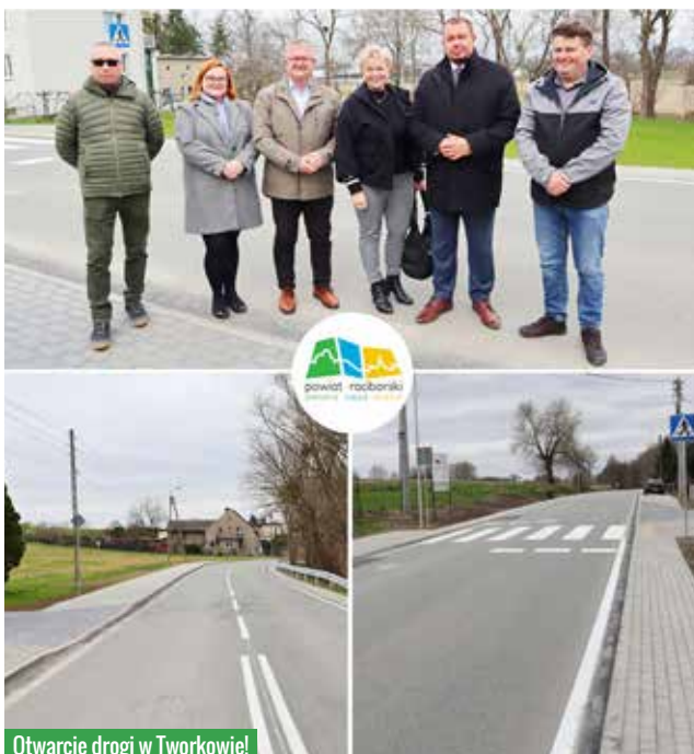
Otwarcie drogi w Tworkowie!