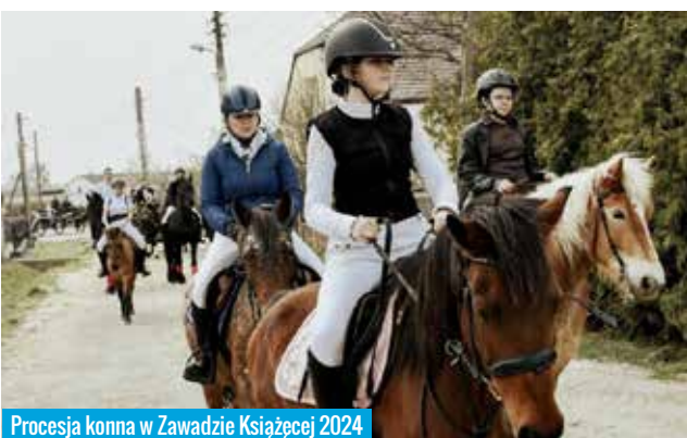
Procesja konna w Zawadzkie Książęcej 2024