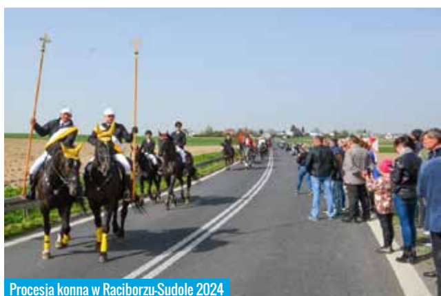
Procesja konna w Racibórz-Sudole 2024