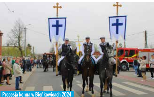
Procesja konna w Bieńkowicach 2024