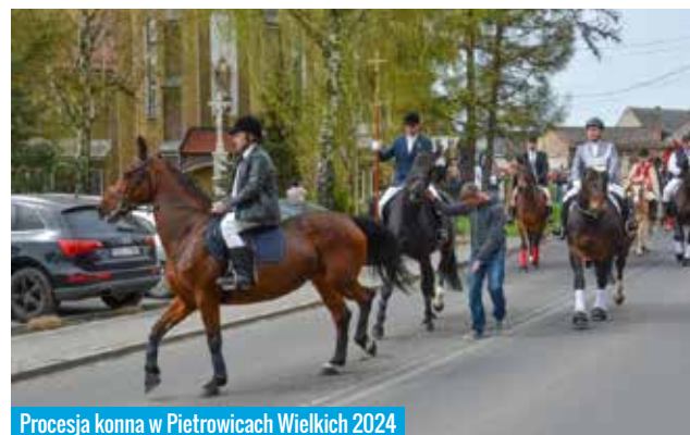
Procesja konna w Pietrowicach Wielkich 2024