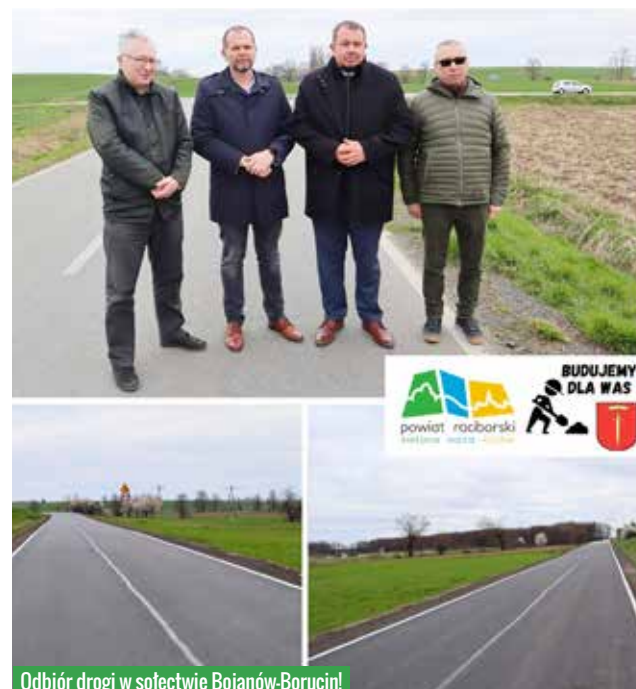
Odbiór drogi w sołectwie Bojanów-Borucin!