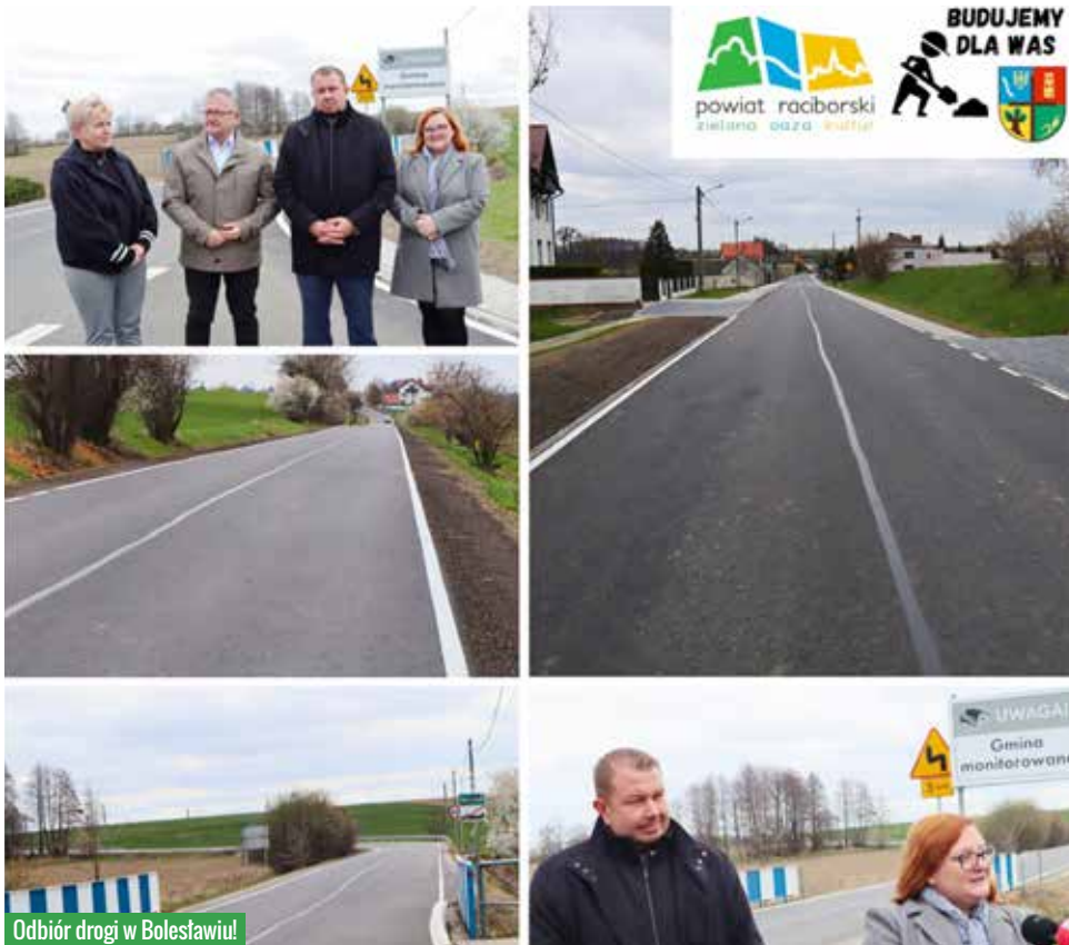
Odbiór drogi w Bolesławiu!

Realizacja inwestycji odbędzie się przy współpracy z Gminą Rudnik – Wójtem Piotrem Rybką. Cieszymy się, że kolejna droga zostanie zmodernizowana, a mieszkańcy będą mogli cieszyć się następnymi udogodnieniami. – dodaje wójt powiatu.