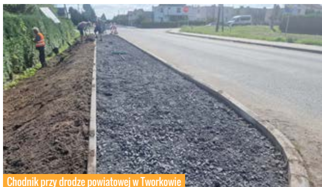
Chodnik przy drodze powiatowej w Tworkowie