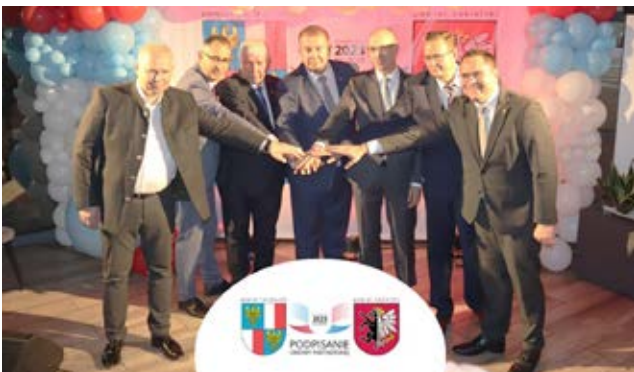
Uroczystość podpisania aktu partnerskiego inaugurującego oficjalną współpracę Powiatu Raciborskiego z Powiatem Nakielskim