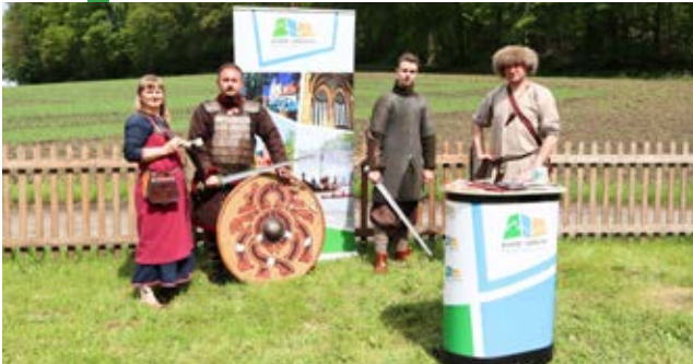
Otwarcie sezonu turystycznego w Zabytkowej Hucie Żelaza Luisenhütte Wocklum