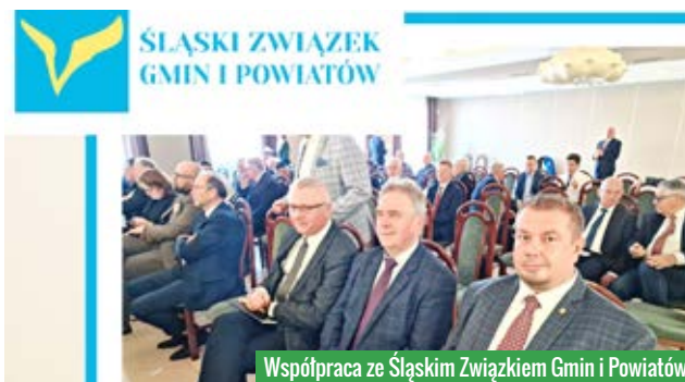
Współpraca ze Śląskim Związkiem Gmin i Powiatów