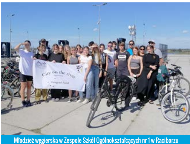
Młodzież węgierska w Zespole Szkół Ogólnokształcących nr 1 w Raciborzu