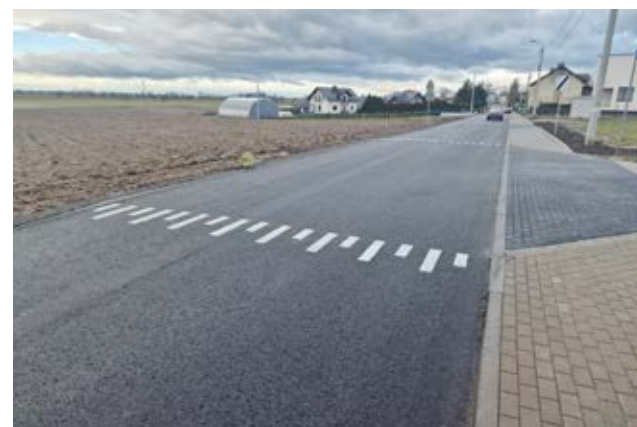
ul. Wiejskiej (Racibórz-Ocice)