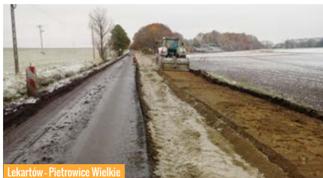
Lekartów - Pietrowice Wielkie