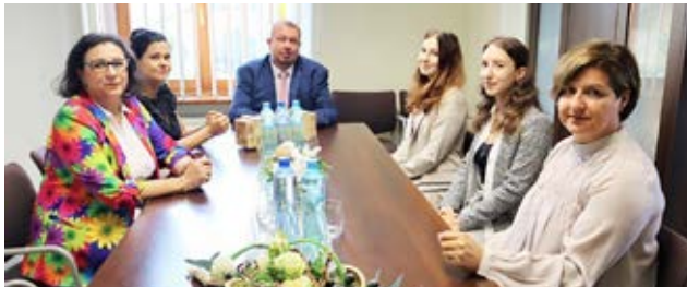
Wymiana młodziży oraz doświadczeń w sferze kulturalnej, sportowej czy gospodarczej to nie jedyne mocne strony współpracy z naszymi partnerami