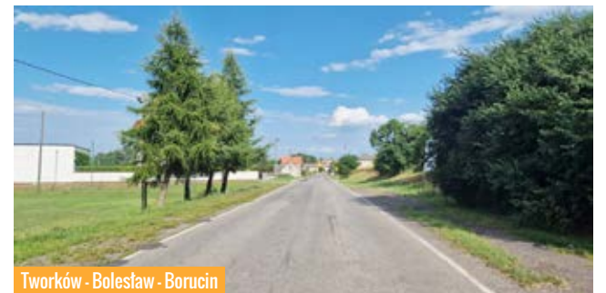
Tworków - Bolesław - Borucin