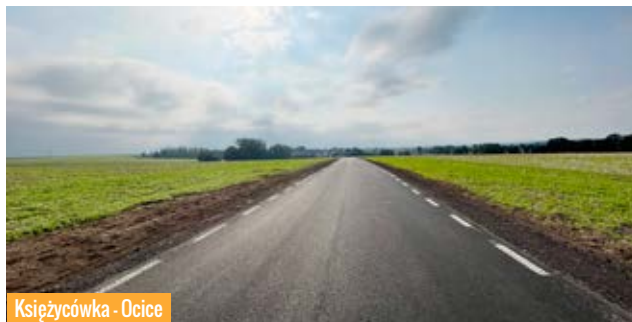
Książycówka - Ocice

Miniony rok to szereg inwestycji drogowych realizowanych przez powiat przy współpracy z gminami, Lasami Państwowymi oraz Środkami Rządowymi.