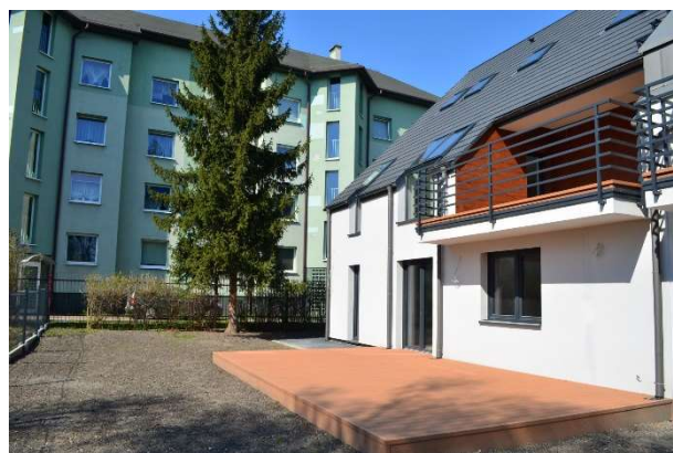
Teren do wyłącznego korzystania