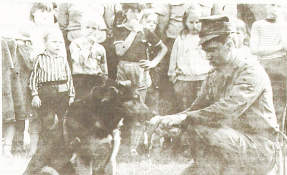
Jednym z punktów programu była tresura psów