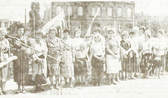
Składanie wieńców pod pomnikiem Matki Polki

Zamówienia przyjmuje i informację udziela — Dział redakcji miejsciej, ul. Długa 9, tel. 35-06.