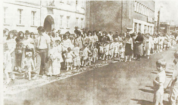
Procesja Bożego Ciała