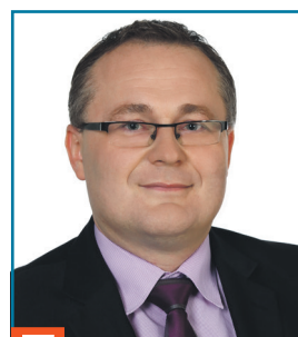
7 Wajda Adam