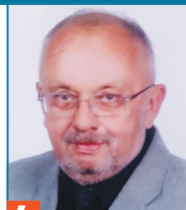
4 Loch Janusz