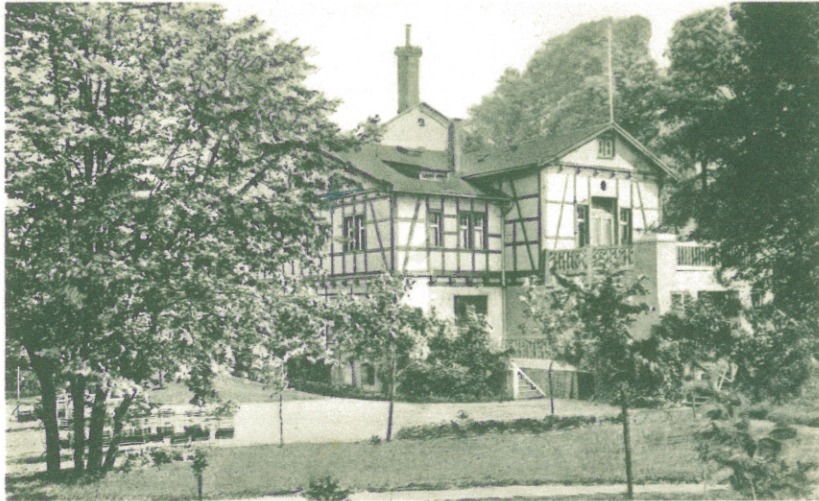
Bootschau, Ruderverein Raibor O.S. & V.