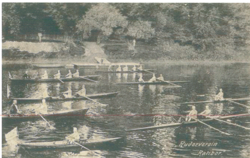
Z życia raciborskiego klubu wioślarskiego