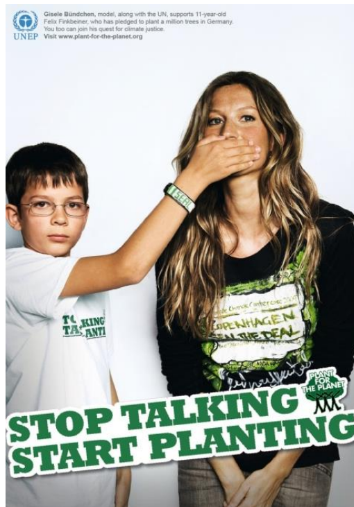
Aktorka Gisele Bündchen