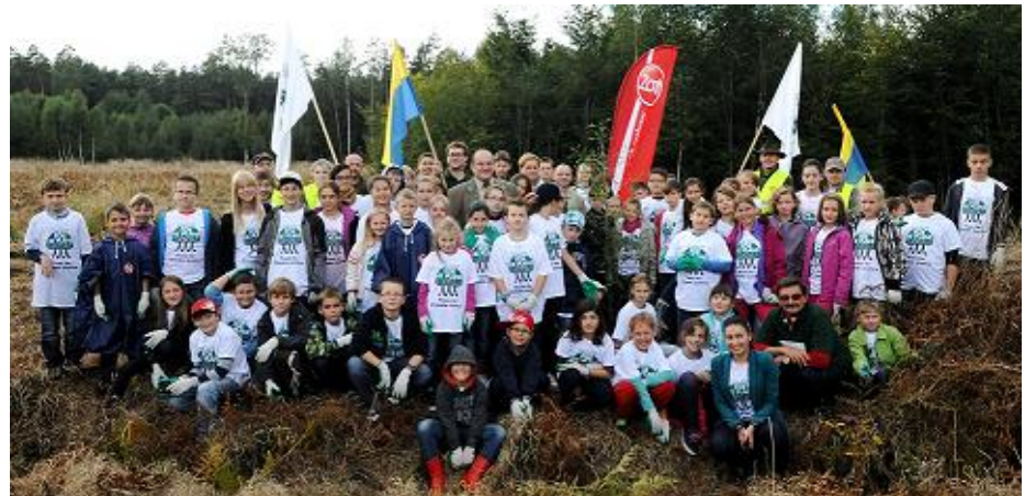
2013, Polska, Opole

Do tej pory odbyły się już 3 akademie współorganizowane przez Grupę ZOTT!