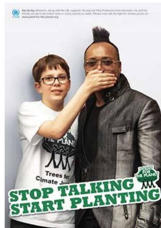
Apl.de.Ap z grupy muzycznej The Black Eyed Peas