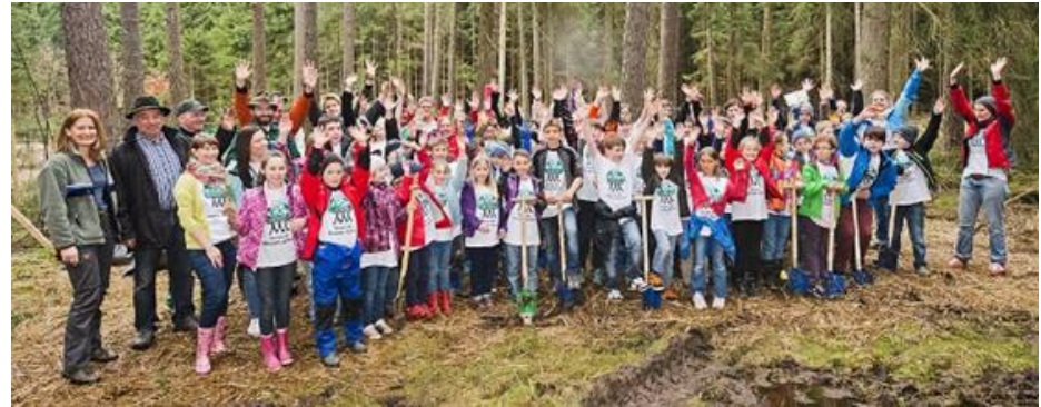
2013, Niemcy, Mertingen

Do tej pory odbyły się już 3 akademie współorganizowane przez Grupę ZOTT!