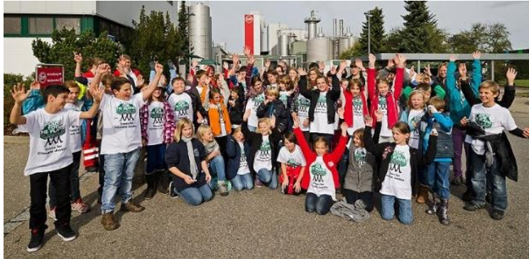
2012, Niemcy, Günzburg